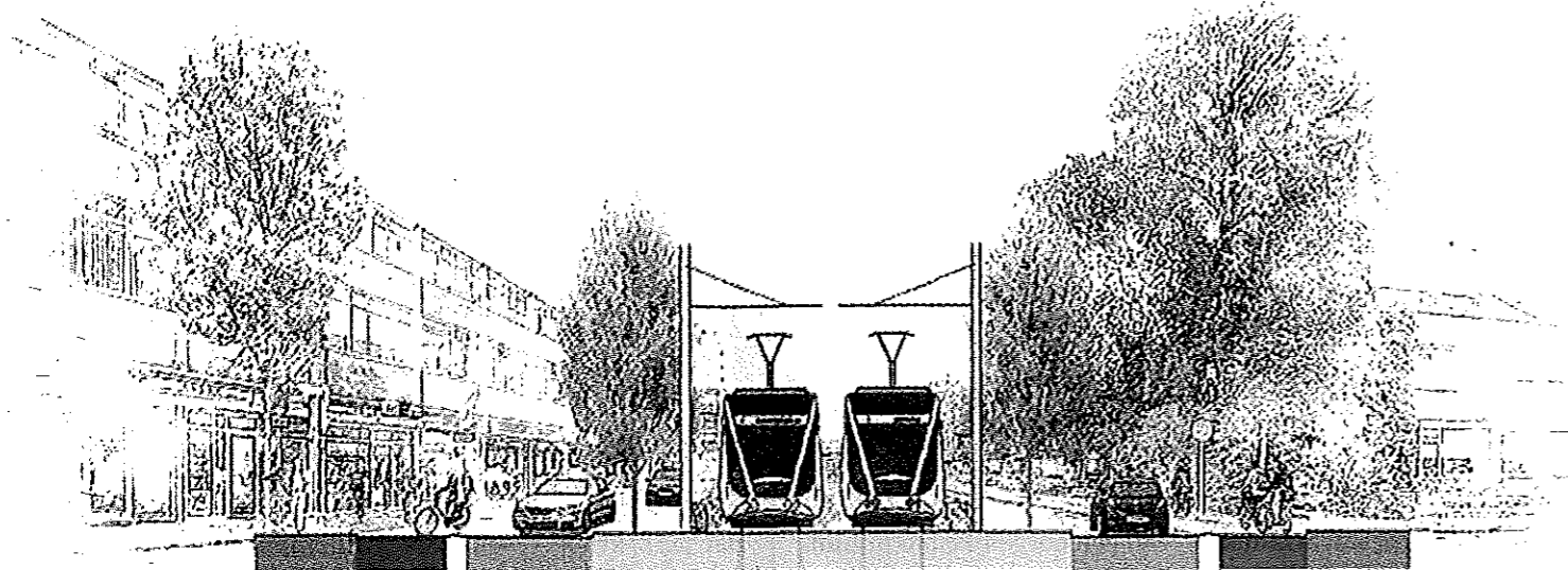
Schets van de toekomstige situatie in de Zonnelaan.